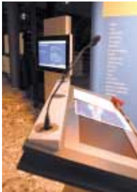
Präsentationslösungen Presentational solutions

User friendly handling of media technology is our top priority!