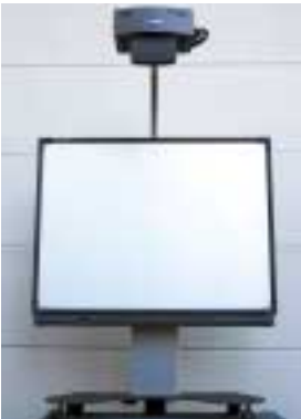
Eigenentwicklung Aktivlift mit Smartboard Propriety development: Active lift with smart board

Die Benutzerfreundliche Bedienbarkeit der Medientechnik steht für uns im Vordergrund!